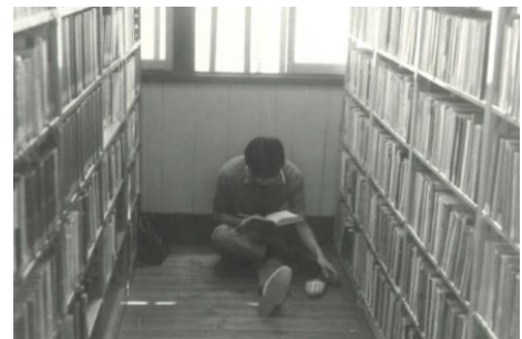
大阪府立図書館茨木ブックステーションに併設されていた茨木市立図書館（昭和43年撮影）