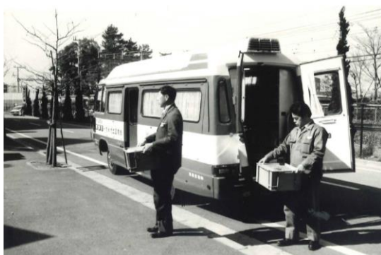
2代目移動図書館ともしび号 （撮影年不明）