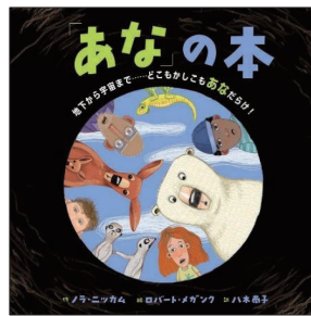
K400 (しらべもの) 400 2025年3月

この本では、その道のりでたくさんの人たちが関わり、いろ んな工具や技、知恵を使って運搬したことが、はく力ある絵で紹 介されています。危険で大変な作業ですが、にぎやかで活気が あり、みんなの力で仕事を成しとげる気持ちよさも伝わってき ます。