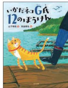
ニーヤマ (にほんのよみもの) ニ ヤマ 2024年10月

トマトは野菜なのか、果物なのか、130年前のアメリカで裁判 が開かれました。南アメリカの高地で生まれた野生のトマトが、 どうやって世界に広がっていったのか、なぜ裁判にまで発展し たのか、知られざるトマトの歴史を知ることができます。各ペ ージでコメントするトマトたちが可愛らしく、絵本のように読みや すいですが、深い情報がつまっています。同じシリーズに、ピー マンとじゃがいもの本もあります。