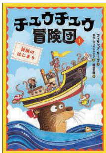
セーリーブ (せかいのよみもの) セ リーブ 2025年5月