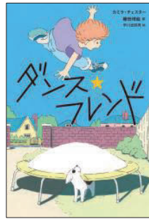
セーチエ (せかいのよみもの) セ チエ 2024年10月

ハラハラドキドキするお話はもちろん、カラフルではく力のあ るイラストで、ネズミたちの世界やペドロの旅を楽しむことができ ます。