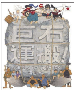
K560 (しらべもの) 560 2024年12月

G氏の視点で進んでいく物語は、ネコならではの事件がたく さんあり、ワクワクします。12の章に分かれていて、一つ一つの 話が短く、読みやすいです。途中でG氏の本名も出てきます。登 場人物や動物同士の会話が楽しいぼうけん物語です。