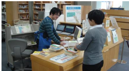
へんきやくカウンター か う ん た ー