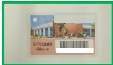
りようかーど 利用カード

じぶん なまえ じゅうしょ 自分の 名前や 住所が わかるものや、 しょうがいしやてちょう としょかん ひと み 障害者手帳を 図書館の人に 見せてください。 としょかん ひと りようかーど つく 図書館の人が 利用カードを 作ります。