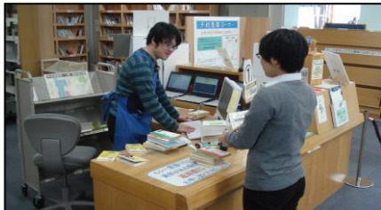
へんきやくカウンター か う ん た ー