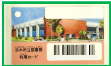
りようかーど 利用カード

じぶん なまえ じゅうしょ 自分の 名前や 住所が わかるものや、 しょうがいしゃてちょう としょかん ひと み 障害者手帳を 図書館の人に 見せてください。 としょかん ひと りようかーど つく 図書館の人が 利用カードを 作ります。