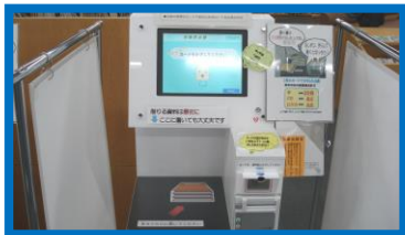
じどう 自動かかしだし機

②「 利用カード 」と 借りたい本を 用意して、 自動かかしだし機 で てつづきを してください。