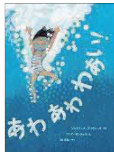
Eーヨミモノーア (えほん) ア