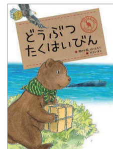
Eーヨミモノード (えほん) ド

なんの動物かあてっこしたり、「あしあし ぱあ」といっしょに声に出すと、もっと楽しく読めますよ。