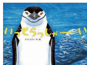
Eーヨミモノーイ (えほん) イ

クジラやワシがリレーしながら、海や空を渡り、にもつを大切に運んでいきます。かんちゃんといっしょにおとどけものになって、旅をしてみませんか？