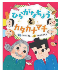
Eーヨミモノーヒ (えほん) ヒ

水しぶきを上げる大海原、力強くおよぎまわるペンギン、魚のむれやおそってくるアザラシやシャチなどが、画面いっぱい描かれていて迫力満点です。