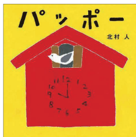
Eーヨミハジメーパ (あかちゃんえほん) ポ パ